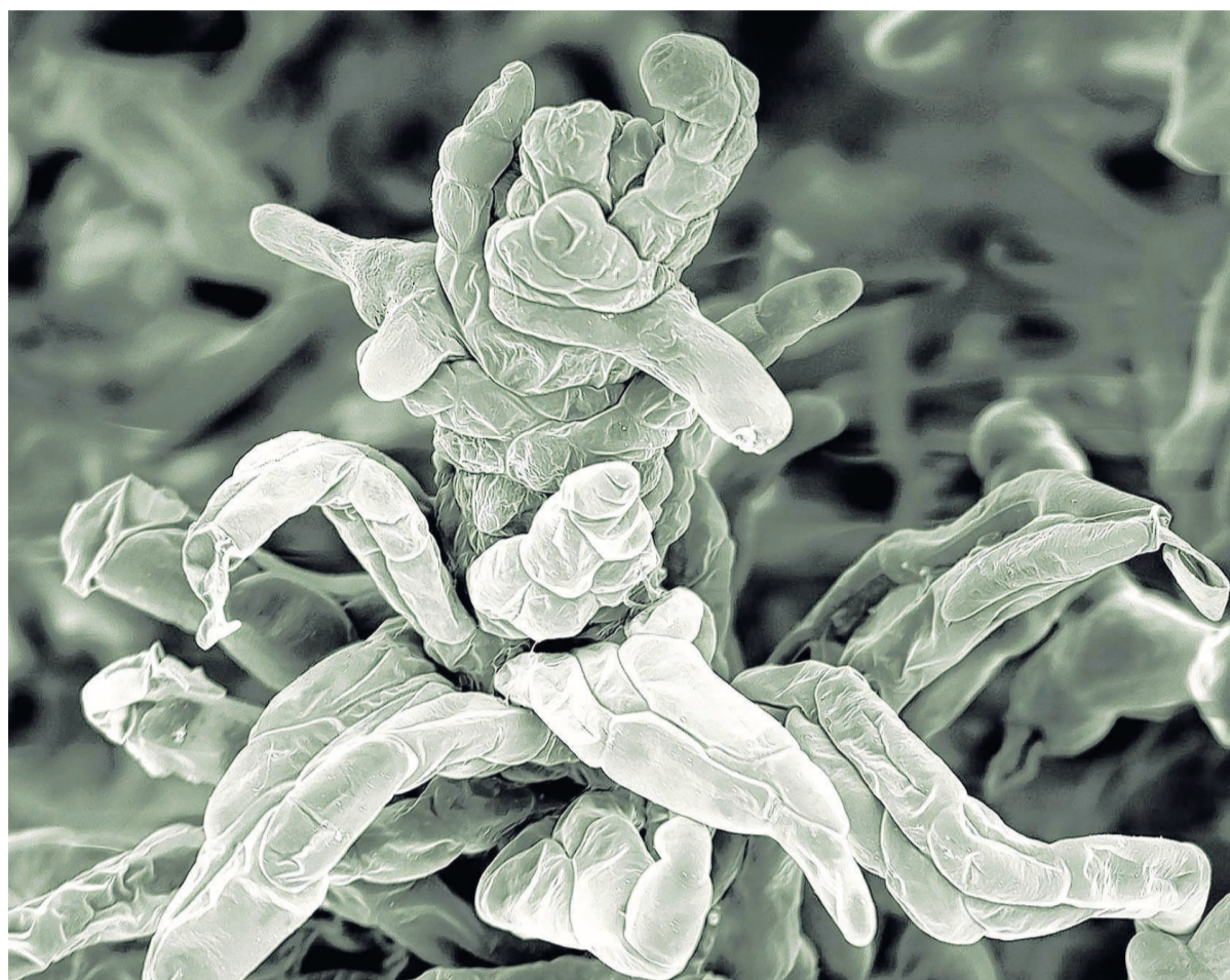
Elektronenmikroskopische Aufnahme einer Moospflanze, an der die Wirkungswiese von Micro-RNAs entdeckt wurde.

Sind Gene aber inaktiv, können sie nicht mehr in Boten-RNAs umgeschrieben werden, es kann auch kein Protein gebildet werden. Alle Lebewesen haben in ihren Zellen außerdem winzige Micro-RNAs. Diese können wiederum die Boten-RNAs und damit letztlich die Eiweißproduktion behindern. Die Freiburger Wissenschaftler haben nun aber herausgefunden, dass diese Micro-RNAs direkt mit den Genen in Kontakt treten und sie so abschalten können. Die Entdeckung,